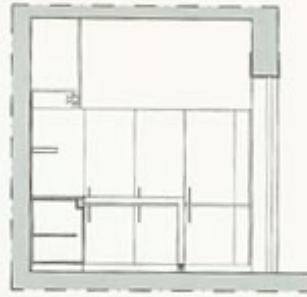
Sezione trasversale / Transverse section