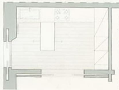
Pianta / Plan